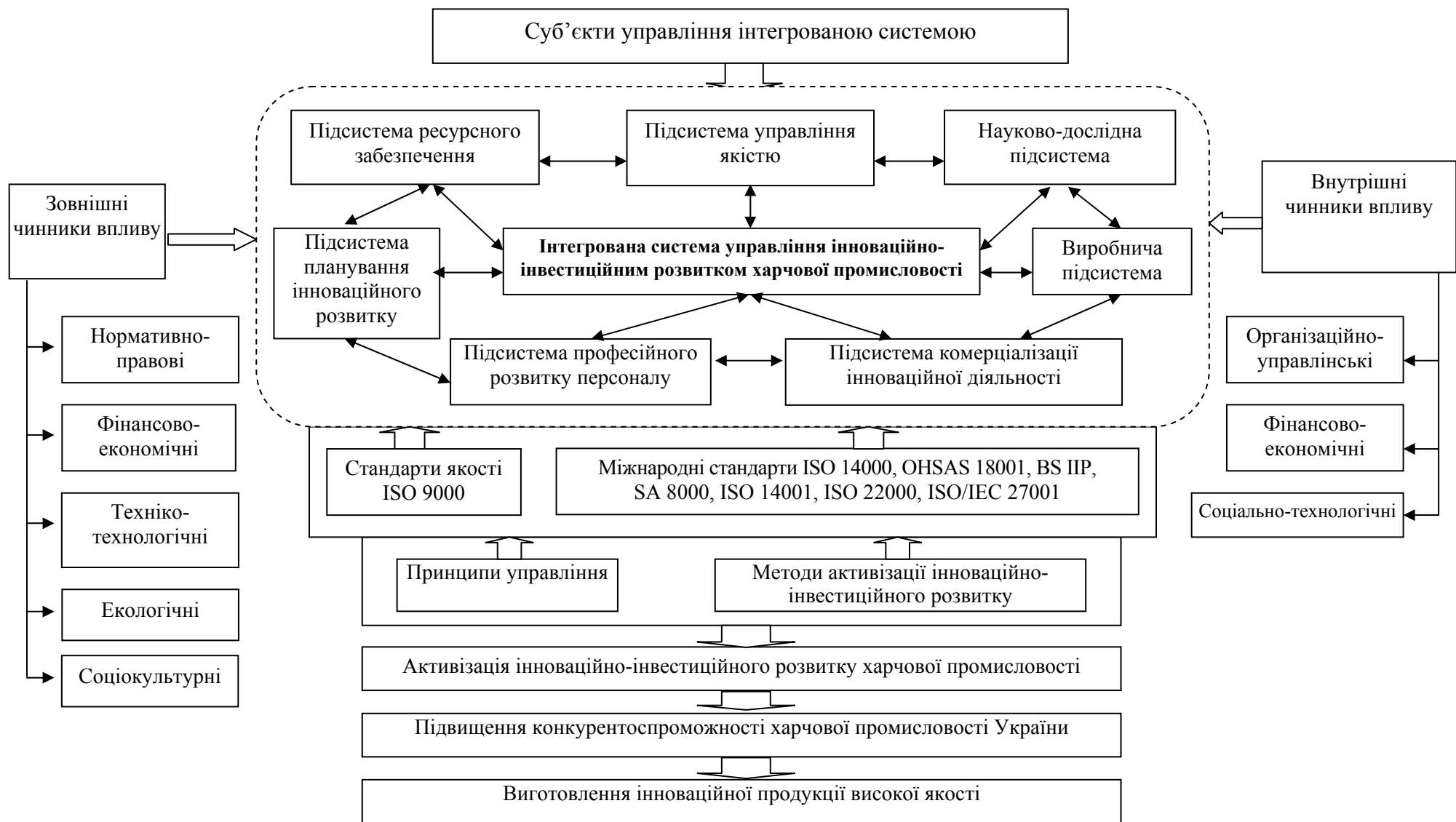
Рис. 4. Інтегрована система управління інноваційно-інвестиційним розвитком харчової промисловості